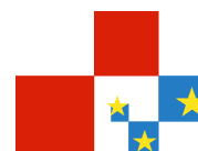
ŽUPANIJSKI SAVJET ZA EU INTEGRACIJE