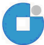
OBRTNIČKA KOMORA KOPRIVNIČKO-KRIŽEVAČKE ŽUPANIJE